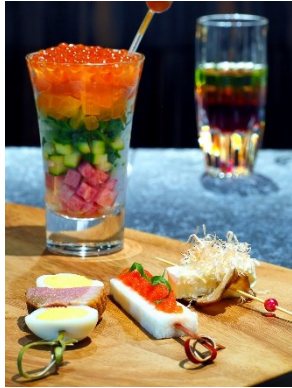
特製ピンチョス&オリジナルカクテル

【プラン内容】 一泊朝食付き（宿泊者専用レストラン「ハフ」11F での朝食 [和・洋チョイス お膳スタイル] ） 特製レインボーピンチョス&オリジナルカクテル（バーラウンジ「雲雲」20F にて提供）、 ワンカップレインボー純米（大関(株) 様より限定販売。LGBTQ のシンボルカラー6 色のラベルデザイン）