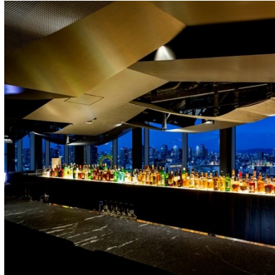
ホテル最上階のバーラウンジ雲雲